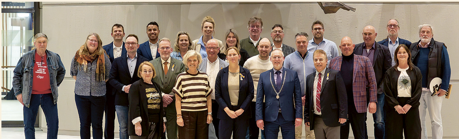
De raad die afscheid heeft genomen.