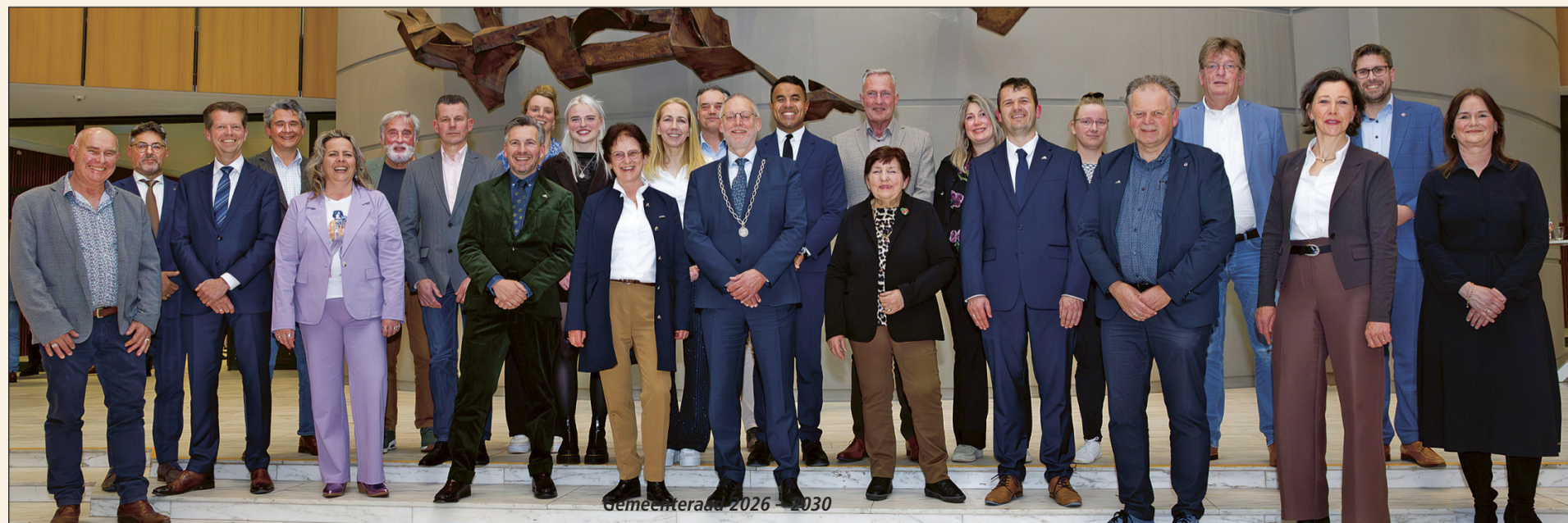
Gemeenteraad 2026 – 2030