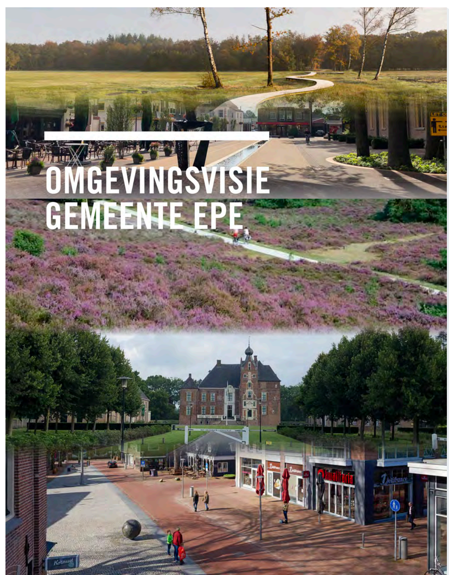
Omgevingsvisie Gemeente Epe

HEEFT U VRAGEN OVER HET GELDENDE GEMEENTELIJK BELEID MET BETREKKING TOT KERKENLAND?