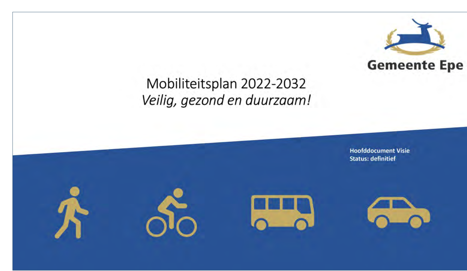
Mobiliteitsplan 2022-2032 Gemeente Epe