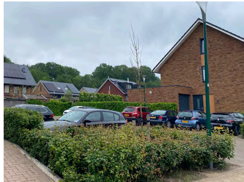
PARKEREN IN EEN HOFJE