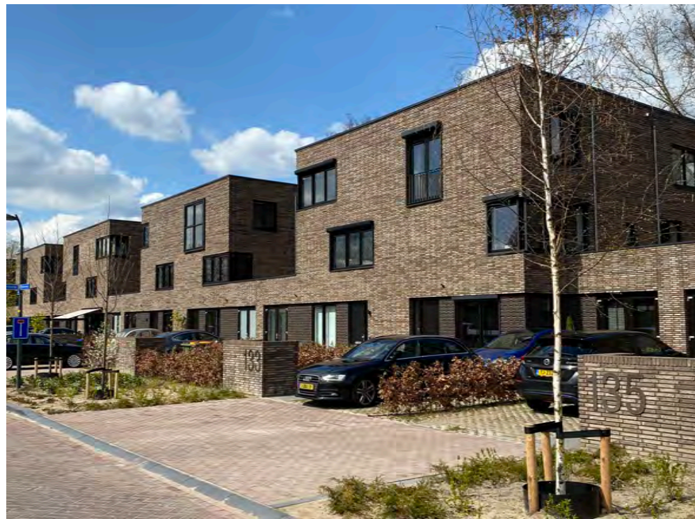
PARKEREN OP EIGEN TERREIN