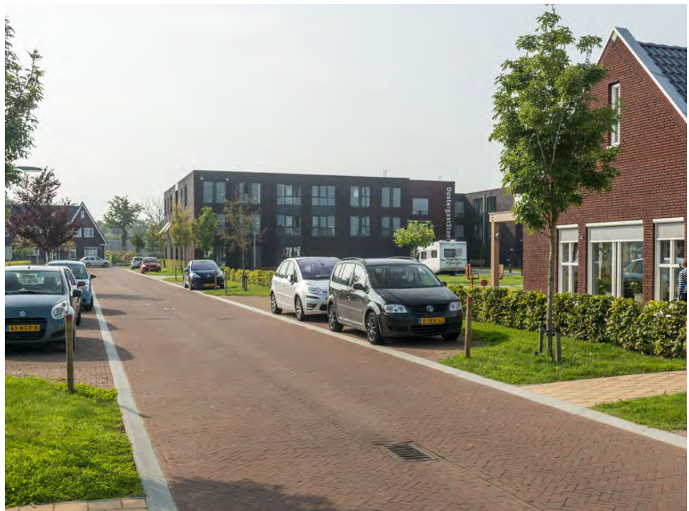
PARKEREN OP STRAAT