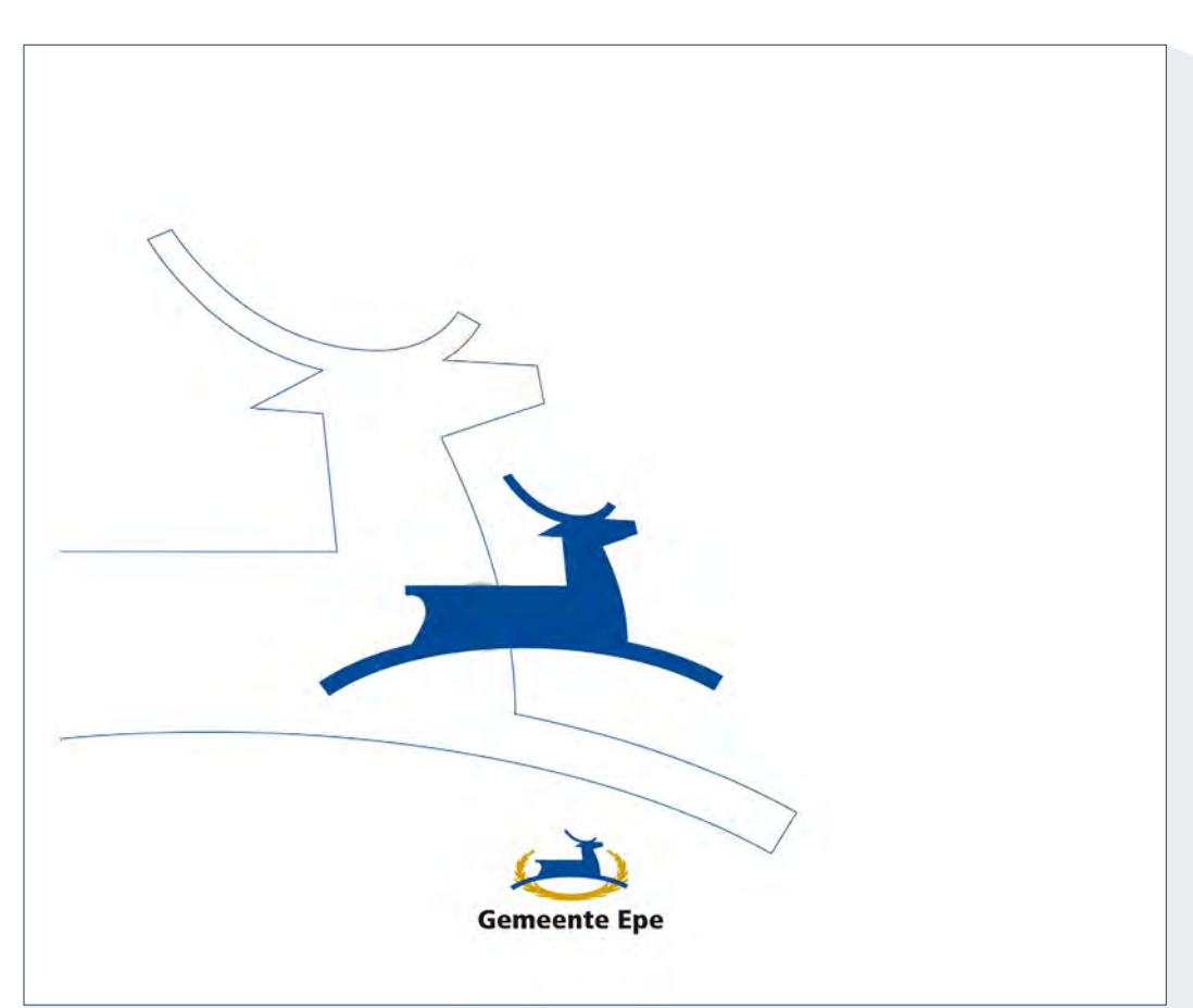
Woonagenda Gemeente Epe