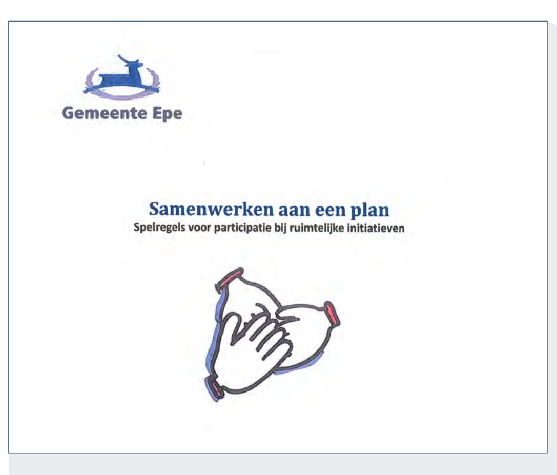
Samenwerken aan een plan Gemeente Epe